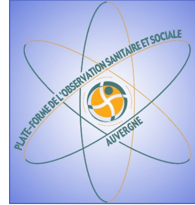
Plate-forme de l'observation sanitaire et sociale d'Auvergne