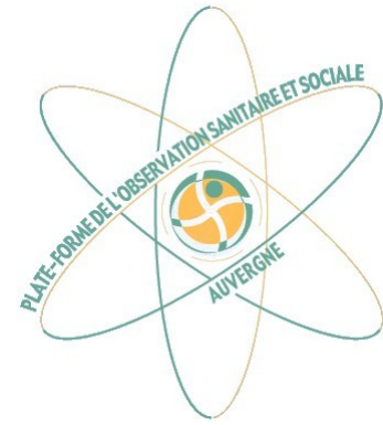
Plate-forme de l'observation sanitaire et sociale d'Auvergne